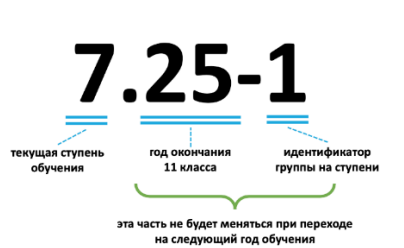
Рис. 6. Наименование классов

Номер класса состоит из трёх частей (см. Рис. 6). Первая цифра указывает текущий год обучения, вторая – календарный год окончания обучения, третья - идентификатор класс-комплекта относительно прочих. Две последние части номера «25-1» сохраняются за учебной группой на весь срок обучения. Первая цифра меняется при переходе с одного года в другой: 7.25-1 => 8.25-1 => 9.25-1 и т.д.